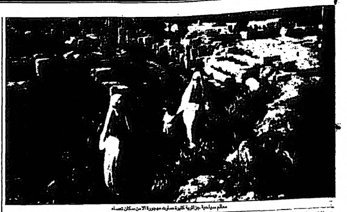
معلم سياحية جزائرية تفتتحه مجموعة الامارات سكان صام

تونس هي اول دولة عربية تتقدم بطلب للانضمام الى المنظمة العربية لحقوق الانسان. وقالت المنظمة العربية لحقوق الانسان في تقريرها الصادر في 1994، ان تونس هي اول دولة عربية تتقدم بطلب للانضمام الى المنظمة العربية لحقوق الانسان. وقالت المنظمة العربية لحقوق الانسان في تقريرها الصادر في 1994، ان تونس هي اول دولة عربية تتقدم بطلب للانضمام الى المنظمة العربية لحقوق الانسان.